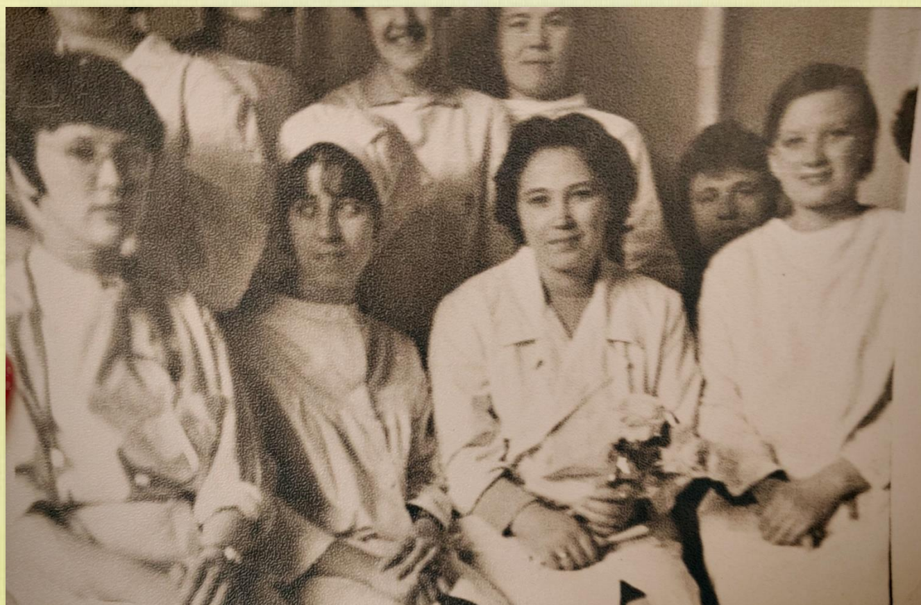
416 зр. 1969 з.