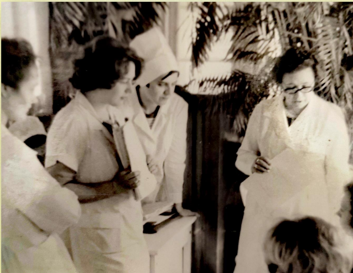
г. Куйбышев, 1979 г.