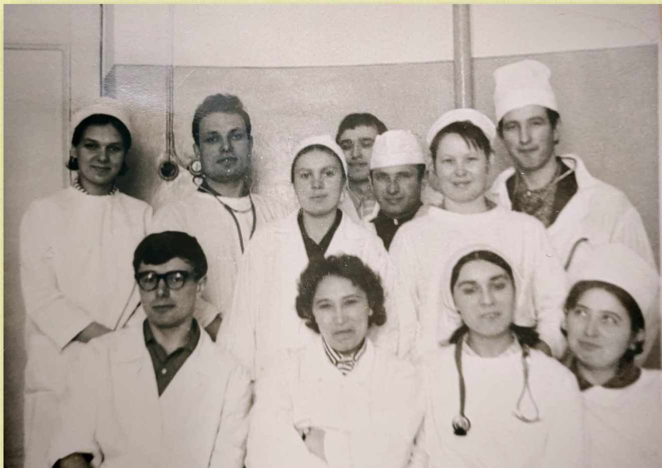
402 зр. 1969 з.